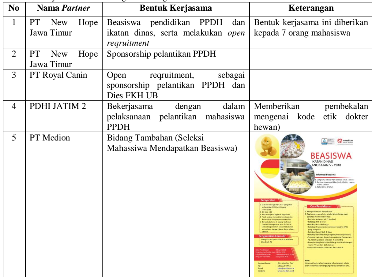
Tabel 8. Kerjasama Dalam Negeri Bidang Tambahan 2018