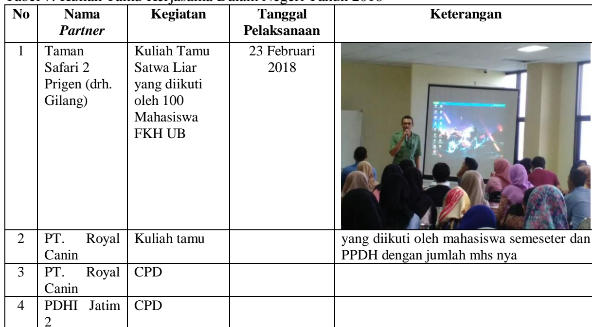
Tabel 7. Kuliah Tamu Kerjasama Dalam Negeri Tahun 2018