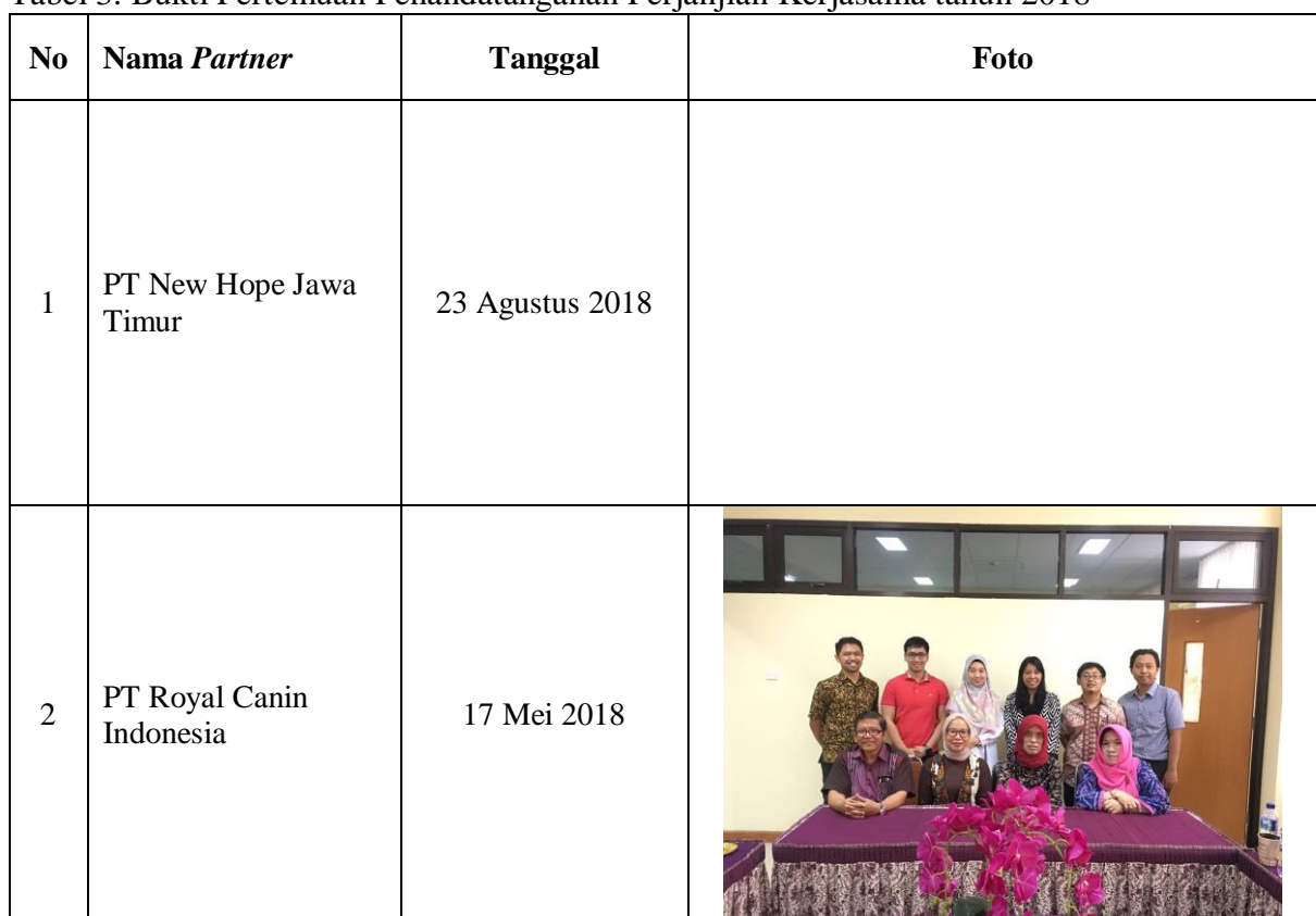
Tabel 3. Bukti Pertemuan Penandatanganan Perjanjian Kerjasama tahun 2018

Adapun bukti pertemuan kerjasama tahun 2018 adalah sebagai berikut :